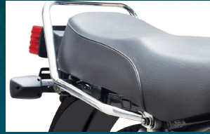
کشاہد آرام دہ سیٹ پیچھے بیٹھنے والے کے لئے گرب بار کے ساتھ