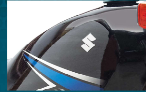
منفرد ڈیزائن کا خوبصورت فیول ٹینک

پاور، اسٹائل، رفتار اور پائیداری میں لاجواب پاکستان کی مقبول ترین 4 اسٹروک موٹر سائیکل سوزوکی 150cc میں دستیاب ہے۔ اپنے پاورفل انجن، کشاہد آرام دہ سیٹ اور خوبصورت ڈیزائن کے ساتھ یہ ایسا تخلیقی شاہکار ہے کہ جو اپنے اسی کا ہو جائے۔