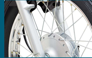
جدید ترین ٹیبل اسکو پک فرنٹ سپینشن