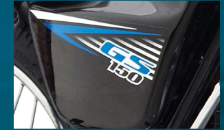
سائڈ کورنر ڈیزائن کے خوبصورت اسٹیکر کے ساتھ

سوزوکی موٹر کار پوریشن، کوئی ٹوئس، ویسے لیفٹ ایکو ہیٹ آپٹیمی فیکیشن، رنگ، میٹیریل اور دوسری چیزوں کو مقامی حالات کے مطابق بدلنے کا حق محفوظ رکھتی ہے۔ کوئی بھی ماڈل ٹوئس ویسے لیفٹ منقطع کیا جاسکتا ہے۔ براہ مہربانی اپنے ڈیلر سے اس طرح کی تبدیلیوں کی تفصیلات کے لئے رجوع کریں۔ ہاؤی کے اصل رنگ کتابچے میں دیئے گئے رنگوں سے مختلف ہو سکتے ہیں۔ ہمیشہ ہیلڈ استعمال کریں۔ آنکھوں کے بچاؤ کے لئے حفاظتی چشمہ بھی آپ کے زیر استعمال رہنا چاہئے۔ اپنا "اور میوزیکل" غور سے پڑھیں اور محفوظ سواری کا لطف اٹھائیں۔