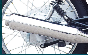
منفرد ڈیزائن کا کولر سائلینٹر