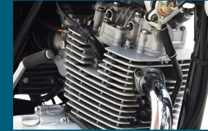
EUROHI ٹیکنالوجی کے ساتھ بننے والا 150cc کا طاقتور انجن