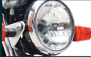
زیادہ تیز روشنی کے لئے ہیڈ لائٹ میں 35 واٹ کا بلب اعلیٰ ڈیزائن کے واضح اور روشن اشارے